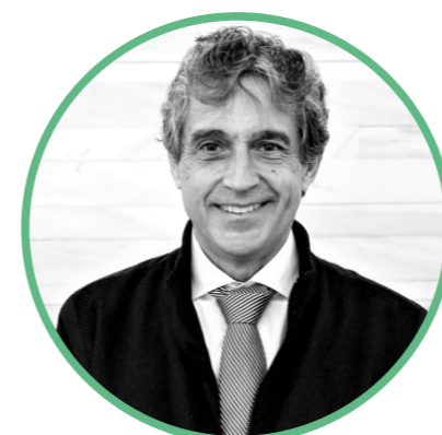
Pablo CAMPOS CALVO-SOTELO