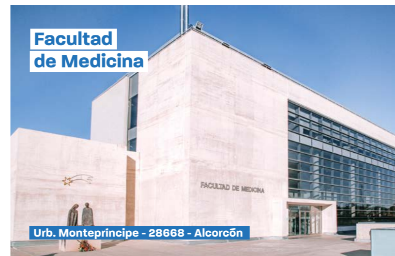
Facultad de Medicina