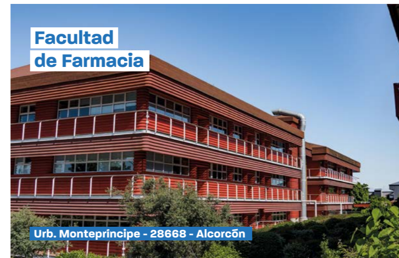
Facultad de Farmacia