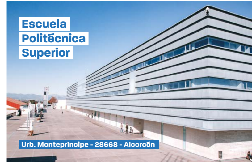
Escuela Politécnica Superior