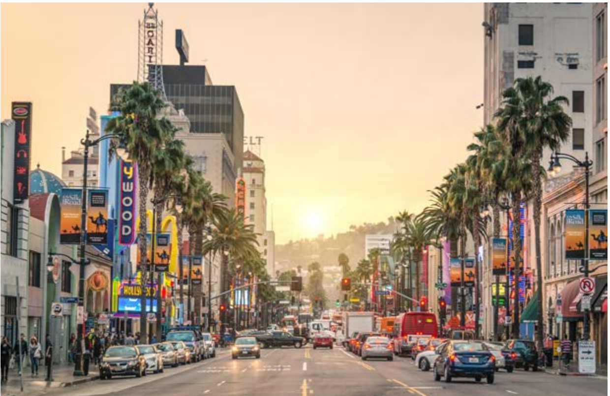
Los Ángeles, EE.UU.