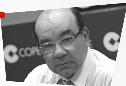
Ángel Expósito (Moderador) Periodista.